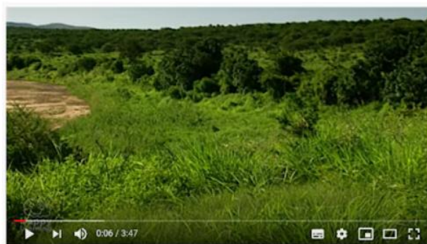
La Materia y sus propiedades | Videos Educativos para Niños